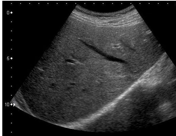
(走査法：右季肋下斜走査) ※走査方法は必ず記載すること

[写真貼付欄] 写真の個人情報 (氏名、ID、生年月日) は必ず削除するか、読み取れないように消去すること。 ※写真裏面に、受験者氏名・受験領域・抄録番号を付記し、はがれないように貼付すること。あるいは、電子画像をコピー&ペーストで貼り付けてもよい。