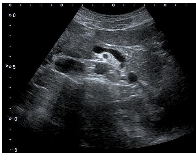
正中季肋下横走査

[写真貼付欄] 写真の個人情報 (氏名、ID、生年月日) は必ず削除するか、読み取れないように消去すること。 ※写真裏面に、受験者氏名・受験領域・抄録番号を付記し、はがれないように貼付すること。あるいは、電子画像をコピー&ペーストで貼り付けてもよい。